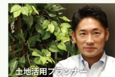
土地活用プランナー