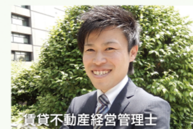
賃貸不動産経営管理士